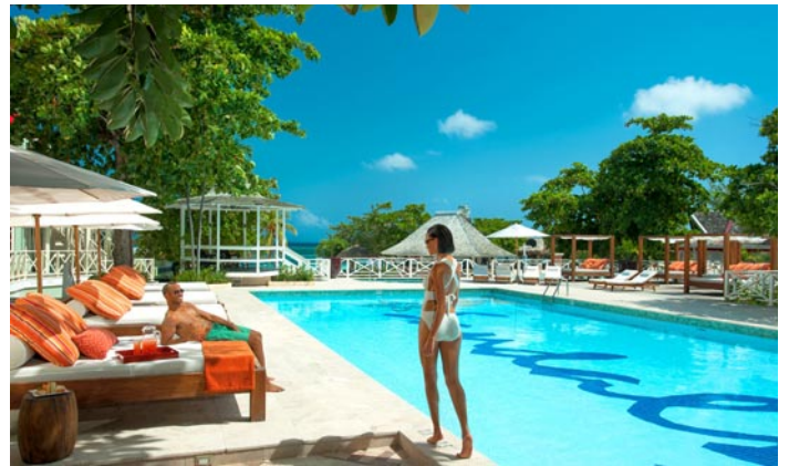
Hier können Sie sich unter der karibischen Sonne entspannen.