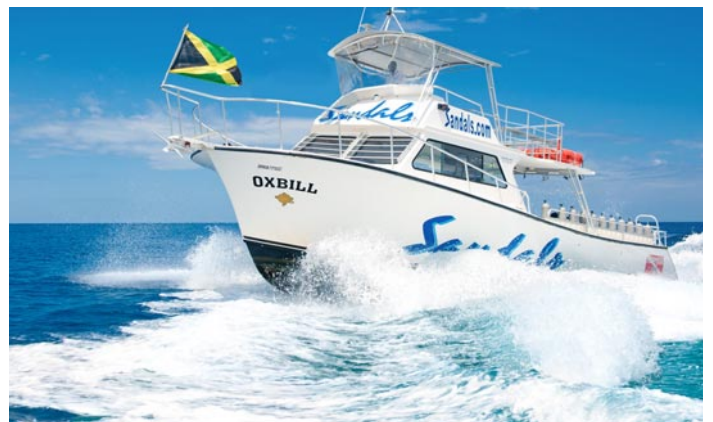
Genießen Sie Ihren Urlaub in einem der exklusivsten Hotels in Montego Bay ganz nach Ihren Vorlieben.