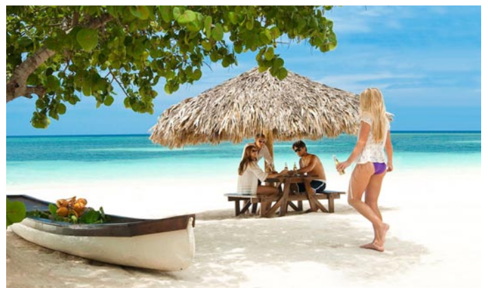
Genießen Sie entspannte Strandtage in exklusiver Atmosphäre.