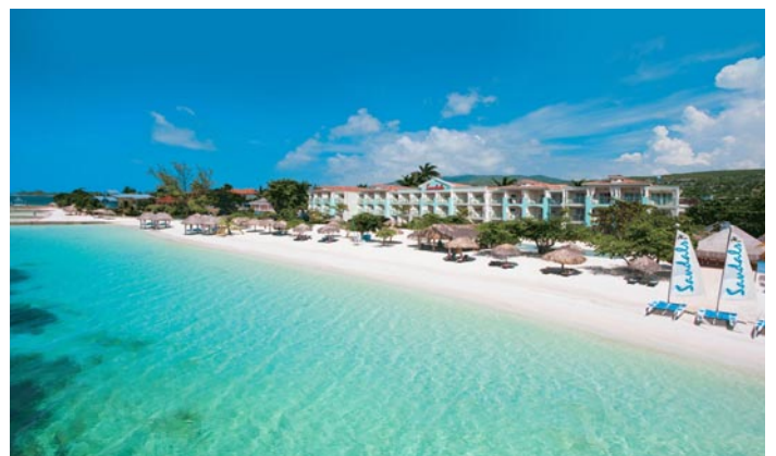
Die perfekte Mischung aus unvergesslichen Erlebnissen, Rückzugsmöglichkeiten und Luxus pur finden Paare im Sandals Montego Bay auf Jamaika.