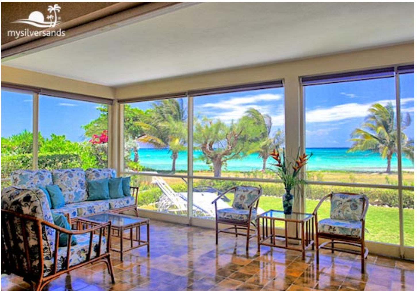
Die Jamahome Villa in Silver Sands bietet genügend Platz für bis zu 12 Personen.