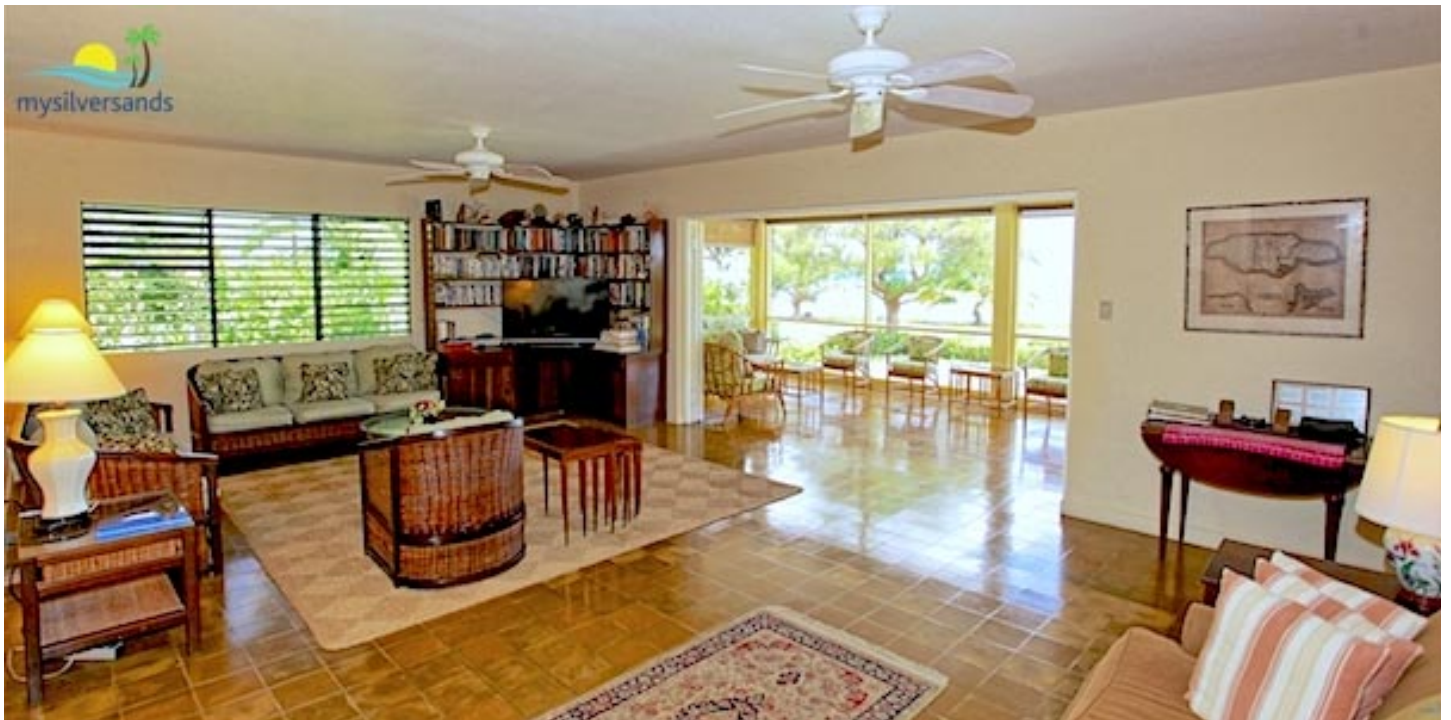
Das geräumige Wohnzimmer geht direkt zur Veranda über. Das Haus ist von einem tropischen Garten mit Blick auf das Meer umgeben.