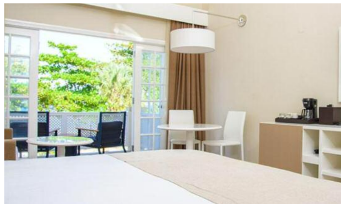
Das Hotel Meliá Braco Village verfügt über 226 Zimmer und 61 Suiten mit Traumblick auf den Strand und das Meer. Der „The Level-Service“ bietet einen ganz besonders exklusiven Service mit zusätzlichen Leistungen und Annehmlichkeiten.