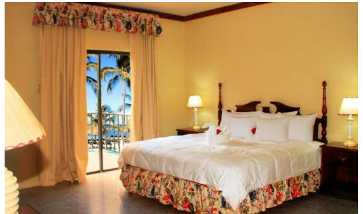
Alle Zimmer des Rooms on the Beach Negril haben Klimaanlage, Bad, Dusche, WC, TV, Zimmersafe, Haarfön, Kaffeemaschine sowie (gebührenpflichtiges) Internet.