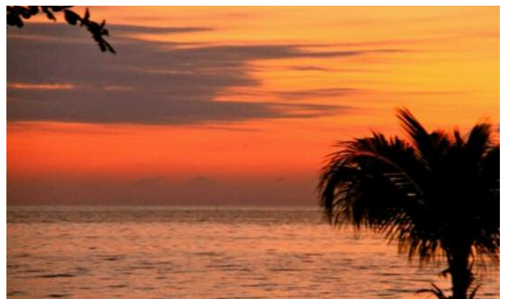
Familiäres Hotel in bester Lage direkt am traumhaften Seven-Mile Beach von Negril gelegen