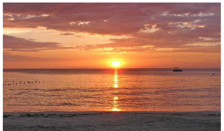
Verbringen Sie Ihren Urlaub in angenehm, entspannter Atmosphäre bei durchschnittlich 30 Grad, rhythmischen Reggae-Klängen und paradiesischen Sandstränden.