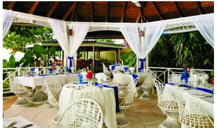
Ein paradiesischer Urlaub: Das Rondel Village ist in eine tropische Gartenanlage eingebettet und bietet viel Platz und Privatsphäre.