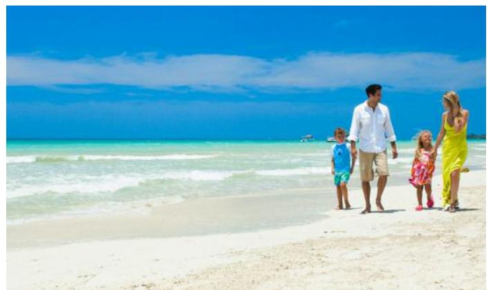
Die gelassene Atmosphäre am 7 mile Beach in Negril haben schon viele Urlauber beeindruckt