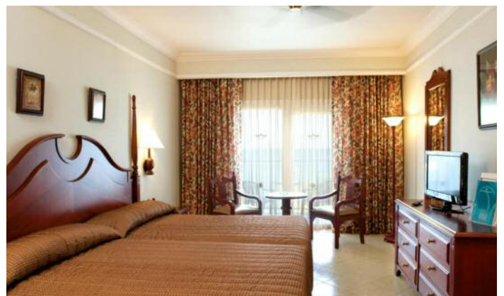
Familiäres 5 Sterne Hotel in bester Lage: Das Hotel bietet mit seinem All-Inklusive-System einen hochqualitativen Service.