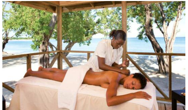
Im Hotel Riu Montego Bay werden Sie den Zauber Jamaikas entdecken und sich perfekt erholen können.