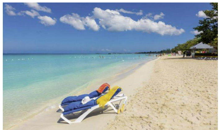
Das kleine 3 Sterne Boutique Hotel ist direkt am langen, feinsandigen Strand in Negril gelegen.