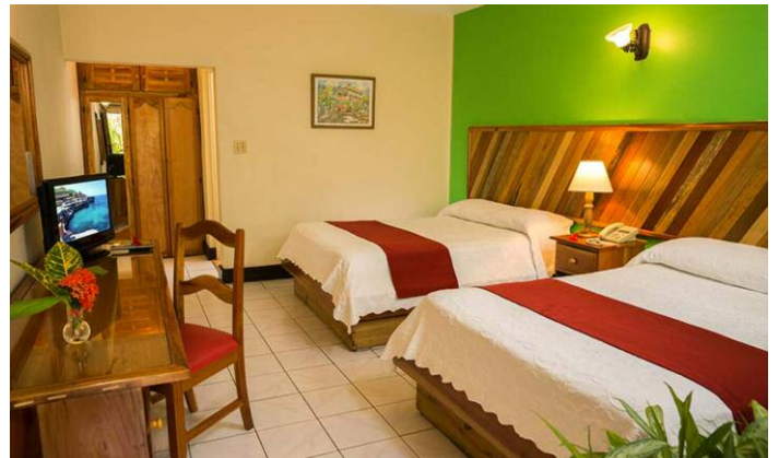
Die Zimmer sind mit Dusche, WC, Klimaanlage, Deckenventilator, Kabel-TV, Telefon und Balkon oder Terrasse ausgestattet.