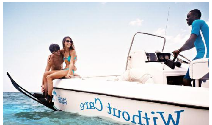
All Inclusive: Welcome-Champagner, alle Mahlzeiten, Snacks und Getränke (24 Stunden), Zimmerservice und Trinkgelder.