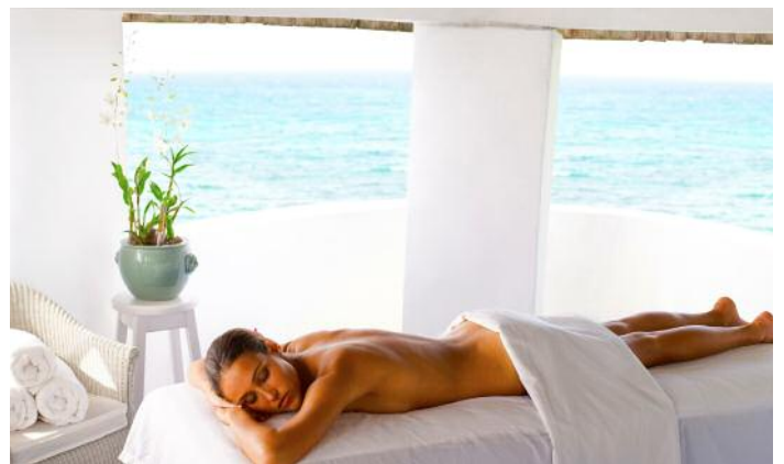
Das schöne Wellness-Center „Charlie's Spa“ bietet Whirlpools und Sauna (inklusive) sowie verschiedene Anwendungen (Reservierung erforderlich, gegen Gebühr).