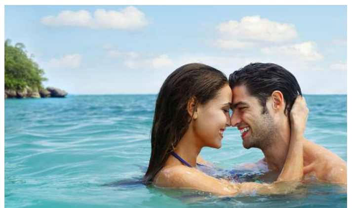
Traumurlaub am Traumstrand. Der Sandstrand ist sehr gepflegt, das Wasser ist klar und sehr sauber.