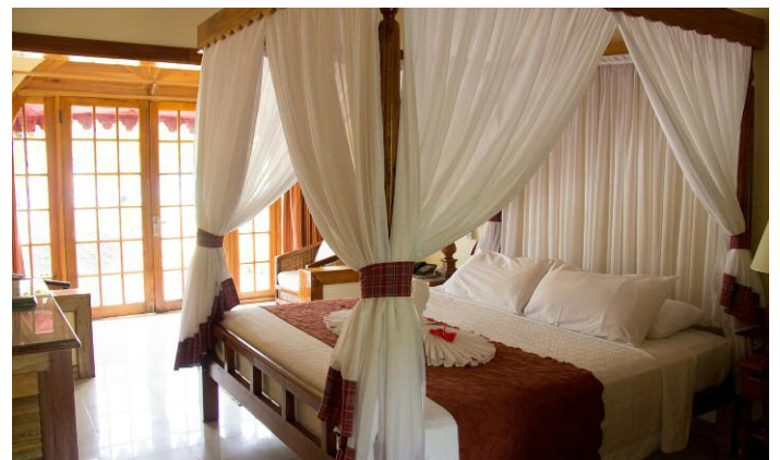
Die Zimmer bieten alle Bad/Dusche, WC, Haartrockner, Telefon, Kabel-TV, Kühlschrank, Klimaanlage, Ventilator und Balkon/Terrasse.